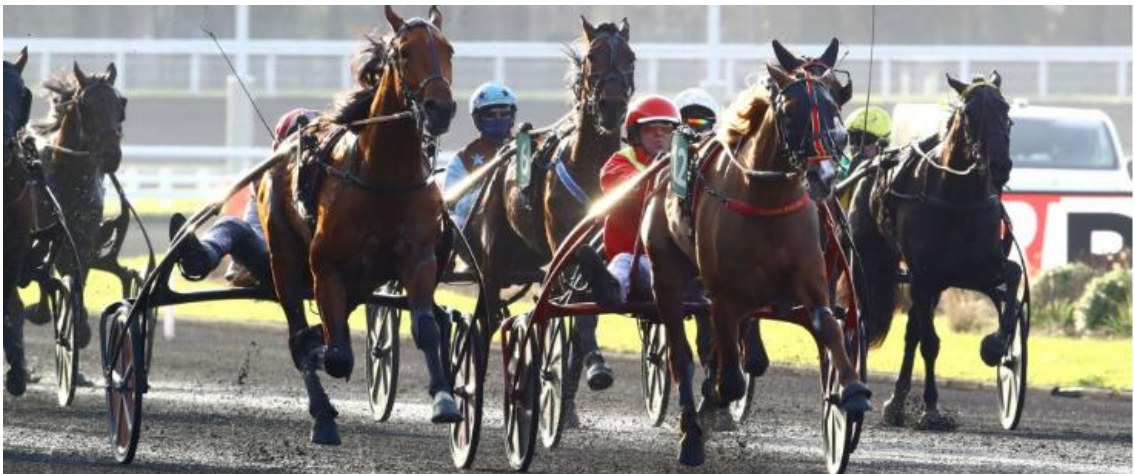
L'arrivée du Critérium des Jeunes 2023 IRL, synonyme de record !