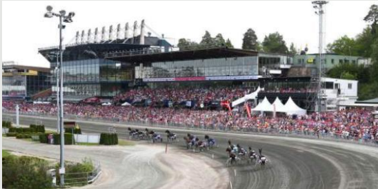
Solvalla, le temple du trot suédois